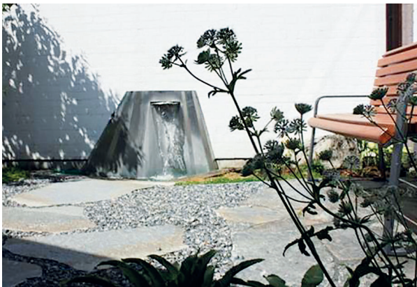
"Raum der Stille" auf dem städtischen Friedhof Garching

Wir arbeiten eng zusammen mit dem Zentrum für Ambulante Hospiz- und Palliativ-Versorgung (ZAHPV) München-Land und dem Hospiz- und Palliativ-Netzwerk des Landkreises München. Außerdem gehören wir der ARGE (Arbeitsgemeinschaft) Hospiz-Bündnis für ambulante Hospiz- und Palliativarbeit im Landkreis München an.